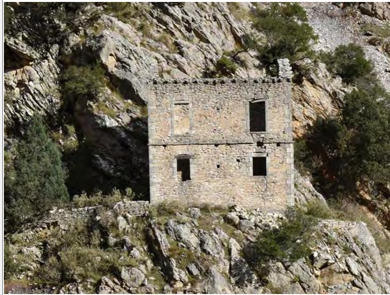
Κούλια - Γέφυρα Κοράκου